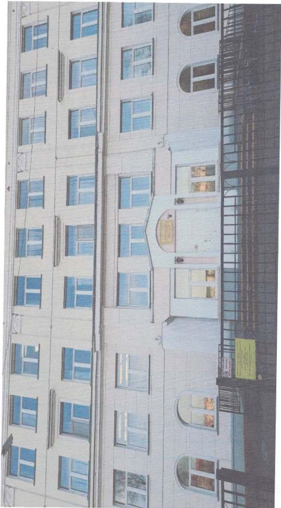
Приложение №6 к паспорту доступности объекта №1